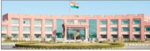
हरियाणा केंद्रीय विश्वविद्यालय का भवन।

महेंद्रगढ़, 23 फरवरी (परमजीत, मोहन): हरियाणा केंद्रीय विश्वविद्यालय महेंद्रगढ़ 25 से 28 फरवरी तक वार्षिकोत्सव, दीक्षांत समारोह, राष्ट्रीय विज्ञान दिवस के उपलक्ष्य में विभिन्न कार्यक्रमों का आयोजन करने जा रहा है। विश्वविद्यालय में होने वाले 4 दिवसीय इन आयोजनों के अंतर्गत दीक्षांत समारोह के अवसर पर माननीय राज्यपाल बंडारू दत्तात्रेय की गरिमामयी उपस्थिति रहेगी जबकि राष्ट्रीय विज्ञान दिवस के अंतर्गत आयोजित होने वाले कार्यक्रमों की शुरुआत का शुभारंभ