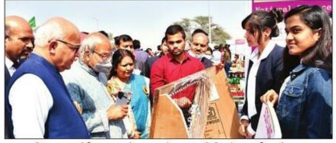
विज्ञान प्रदर्शनी का अवलोकन करते मुख्य अतिथि प्रो. एचसी वर्मा।